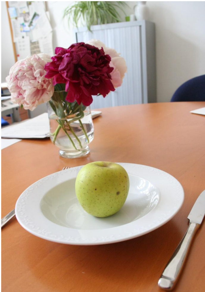
Es muss nicht immer Fleisch auf den Teller kommen

Zusätzlich bieten viele Landwirte ihre Erzeugnisse auf den Bauernmärkten in der Region Hannover an. Informationen unter www.hannover.de unter dem Suchbegriff „Bauernmarkt“.